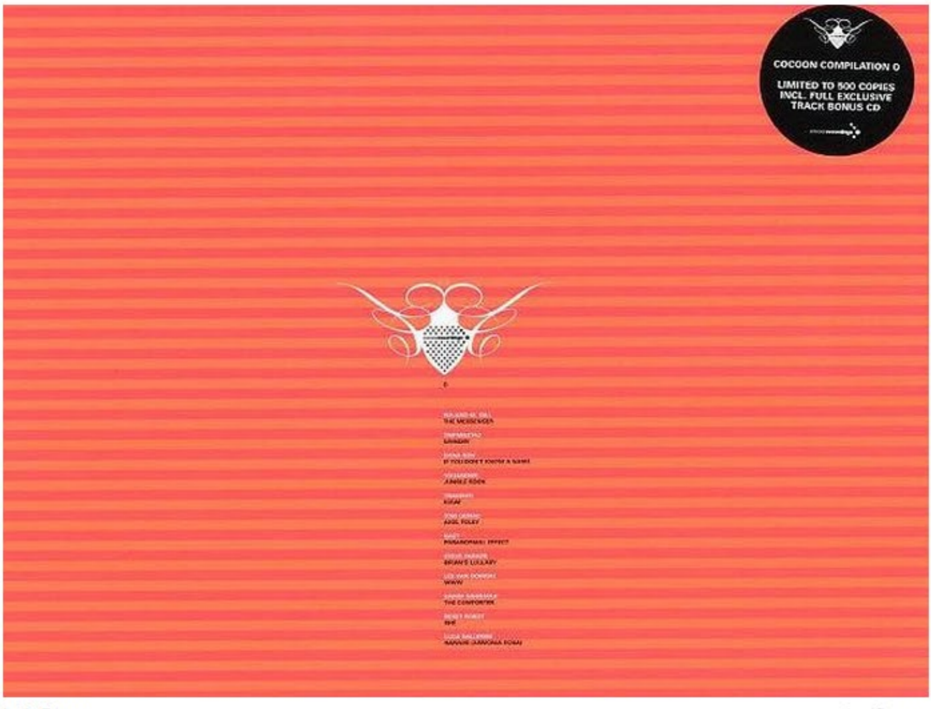
Let's Dance.